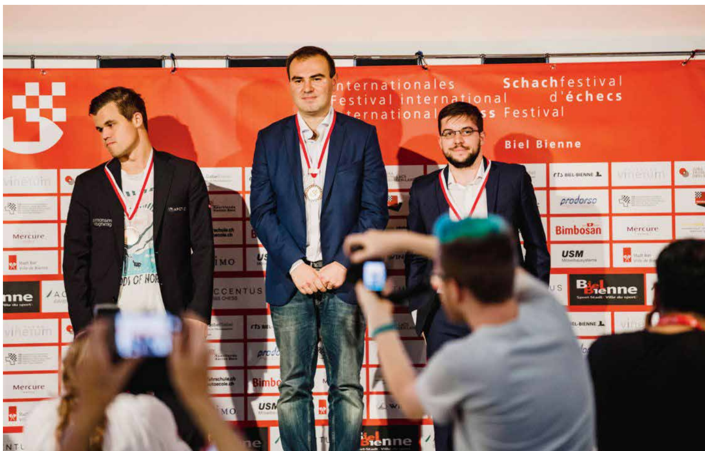
Pour sa première venue à Bienne, Shakhryiar Mamedyarov a fait fort. Il a dominé le grandissime favori Magnus Carlsen, qui termine sur la deuxième marche du podium, devant le Français Maxime Vachier-Lagrave, quadruple vainqueur du tournoi.